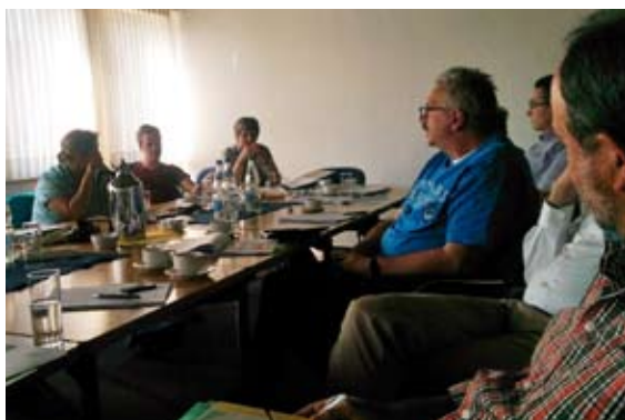
Viel Detailarbeit und Diskussion: Mitglieder der Koordinierungsgruppe.

Damit ist in der Koordinierungsgruppe die gesamte Breite der Pfarrei abgebildet. Das gilt sowohl, was die regionale Verteilung und die Gemeindestandorte angeht, als auch was die Altersstruktur der Katholiken betrifft.