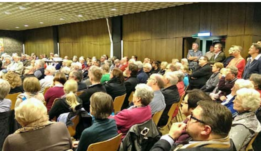
Pfarrkonferenz im Herbst 2015: Offenheit und Transparenz waren Leitmotive für Schritte zur Diskussion der Entschlüsse des Votums im Plenum der Konferenz.